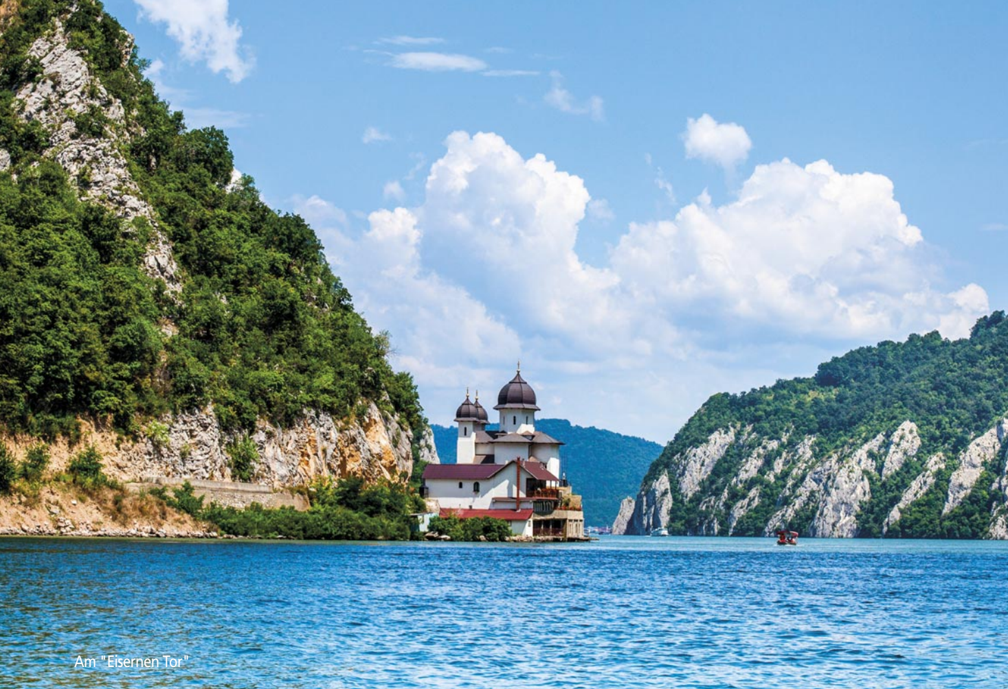
Am "Eisernen Tor"