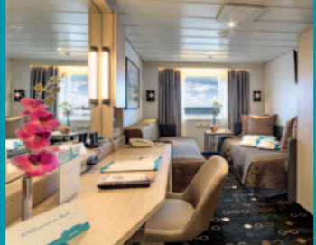
2-Bett, Saturn-/Orion-Deck (Kat. I, K, L, M)