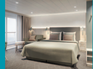
2-Bett, Junior-Suite, Balkon, Jupiter-/Lido-Deck (Kat. S, T)