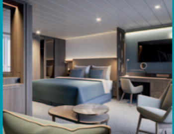
2-Bett-Suite, Balkon, Lido-Deck (Kat. V)

REISEBÜRO WAGNER - DIE KREUZFAHRTSPEZIALISTEN - Darmstädter Straße 45 · 65474 Bischofsheim Telefon: (0 61 44) 3 34 80 E-Mail: reisebuero.wagner@holidayland.de Internet: www.reisebuero-wagner-gmbh.de