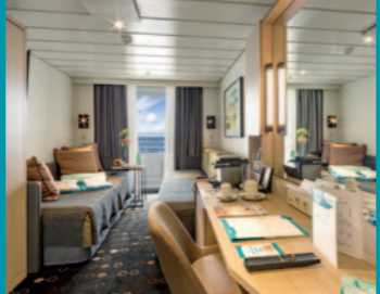
2-Bett, Superior, Balkon, Orion-Deck (Kat. P, PG)