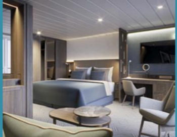
2-Bett-Suite, Balkon, Lido-Deck (Kat. V)

REISEBÜRO WAGNER – DIE KREUZFAHRTSPEZIALISTEN – Darmstädter Straße 45 · 65474 Bischofsheim Telefon: (0 61 44) 3 34 80 E-Mail: reisebuero.wagner@holidayland.de Internet: www.reisebuero-wagner-gmbh.de