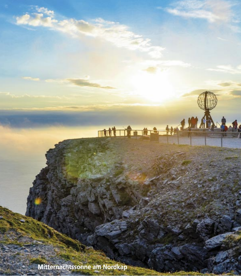
Mitternachtssonne am Nordkap