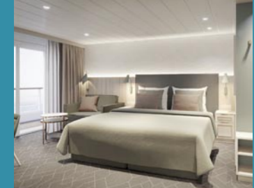
2-Bett, Junior-Suite, Balkon, Jupiter-/Lido-Deck (Kat. S, T)