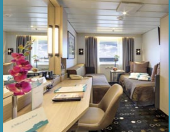
2-Bett, Saturn-/Orion-Deck (Kat. I, K, L, M)