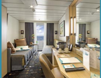
2-Bett, Superior, Balkon, Orion-Deck (Kat. P, PG)