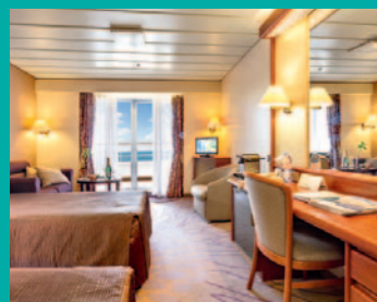
2-Bett, Junior-Suite, Balkon, Jupiter-/Lido-Deck (Kat. S, T)