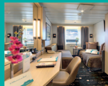
2-Bett, Saturn-/Orion-Deck (Kat. I, K, L, M)