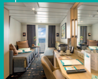
2-Bett, Superior, Balkon, Orion-Deck (Kat. P, PG)